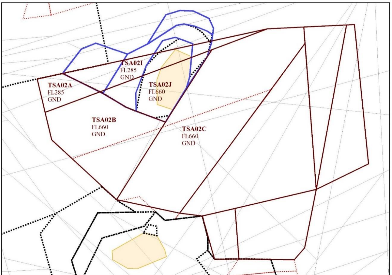
Rys.3 – Projekt nowych granic TSA02 na tle starych granic. Pozostałe granice pionowe nie ulegają zmianie.